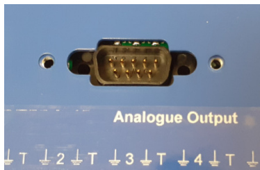
Obrázek 7. 9 pinový RS232 terminál Port