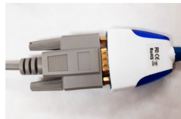
9kolíkový křížený kabel připojený k převodníku RS232 na USB.

Jednoduše připojte křížený kabel k přístroji a převodníku RS232 a nainstalujte do PC. Aktivujte software terminálového portu podle nastavení uvedených výše a zobrazí se hlavní nabídka zařízení. Provedte změny a odpojte se.